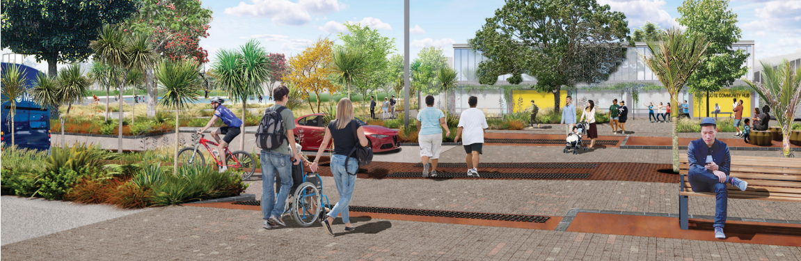
Artist's impression of the new Ernie Mays St extension, with the new community hub in the background.

九月学校假期活动。查看他们以及 Glenfield and Birkenhead 图书馆的免费学校假期活动。详情请访问 facebook.com/Northcote.Library/。