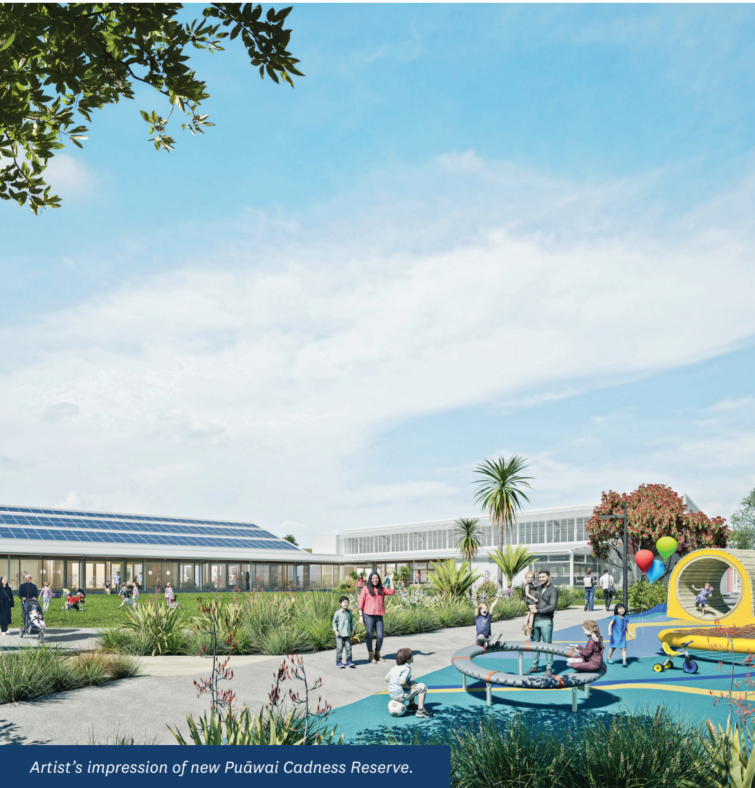
Artist's impression of new Puāwai Cadness Reserve.

在施工前，图书馆将于 2026 年初暂时迁至 Ernie Mays 街 1 号（College Road 拐角处）。