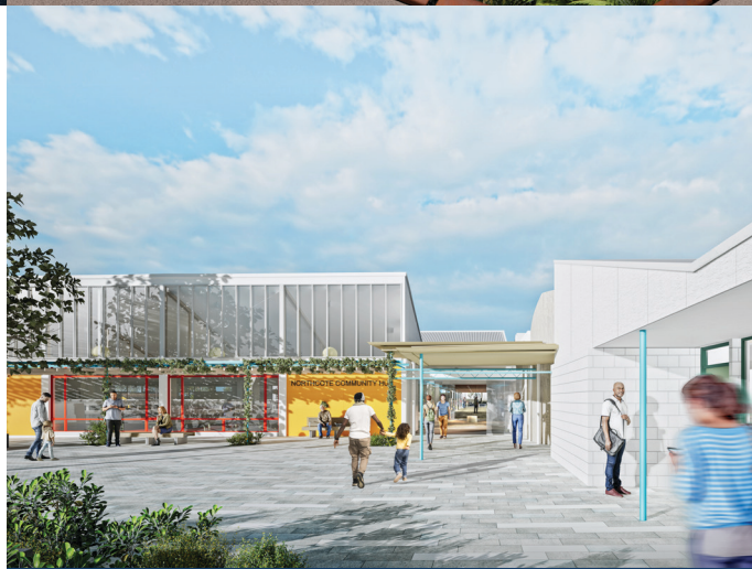
Artist's impression of new Northcote community hub.