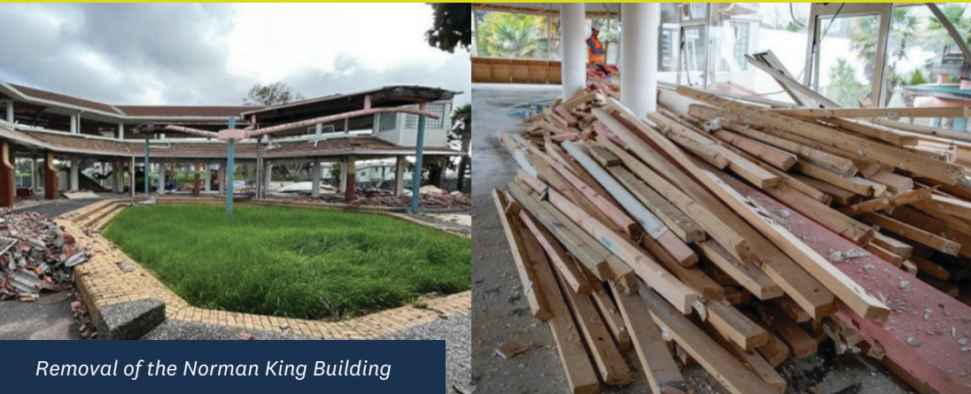
Removal of the Norman King Building

Northcote 不断发展，当地居民正齐心协力，致力于将其打造成为一个更加美好、更加友好的社区。Northcote Together——一个由新居民组成的团体——正在为社区带来更多乐趣。他们去年夏天支持了我们举办的热门活动，例如 Northcote 的“极速前进”和“狗狗一日游”，并将继续支持和推广这些活动。