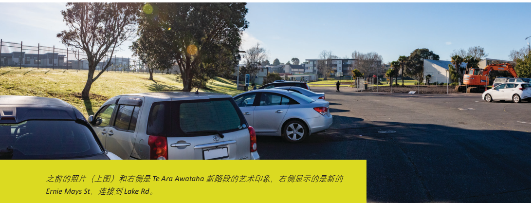
之前的照片（上图）和右侧是 Te Ara Awataha 新路段的艺术印象，右侧显示的是新的 Ernie Mays St. 连接到 Lake Rd。

Northcote 不断发展的社区理应拥有更广阔的空间——因此，我们将首先升级公共设施，并从 2027 年开始改善购物区。